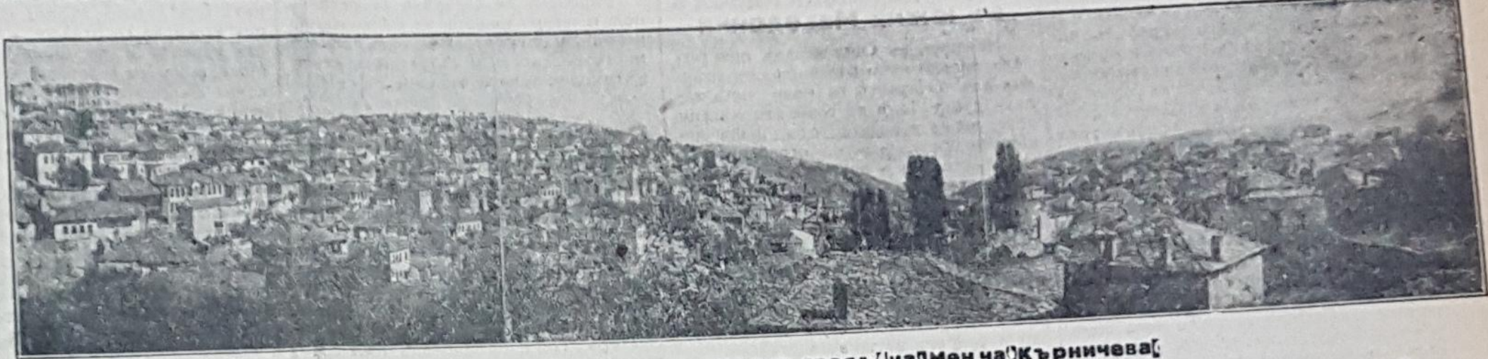
гр о Крушево, родния градъ [на] мен ча [Кърничева]