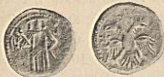
Обр. 66. — Мѣдна монета въ Будапеща.

Нека видимъ първо, на кой царь могатъ да се припишатъ тѣзи монети. Буквата M върху тѣхъ не може да означава друго, освѣнъ името на царя, който е сѣкълъ монетитѣ. Отъ българскитѣ царе, като сж сѣкли монети и чието име начева съ буква М, имаме само слѣднитѣ: Михалъ II Асѣнь, Михаилъ Шишманъ и Михаилъ, синътъ на Ив. Александра, който е взималъ участие заедно съ баща си въ управлението на царството и който е изобразенъ върху неговитѣ монети. Отъ българскитѣ монети само върху ония отъ първитѣ двама владѣтели и отъ Ив. Александра се срѣща