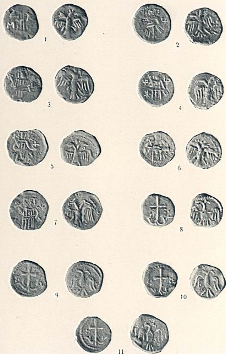
Бронзови монети на Михаилъ Шишманъ.