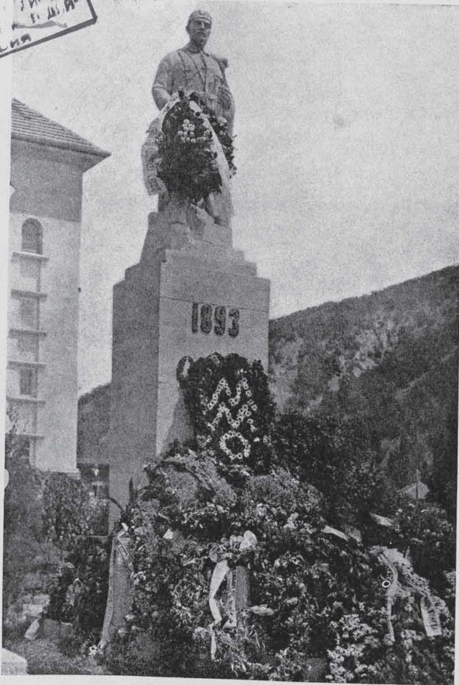
Паметникътъ на Македонския незнаенъ четникъ откритъ на 2. Августъ — Илинденъ 1933 год. въ гр. Горна-Джумая