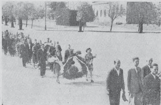
Делегация на Варненското д-во „Илинденъ“ съ вѣнеца носенъ отъ г-ци, положенъ на 4.XI. 1943 г. предъ тленнитѣ останки на Царя-Обединителъ Борисъ III, ведно съ тия на другитѣ делегации отъ Варна