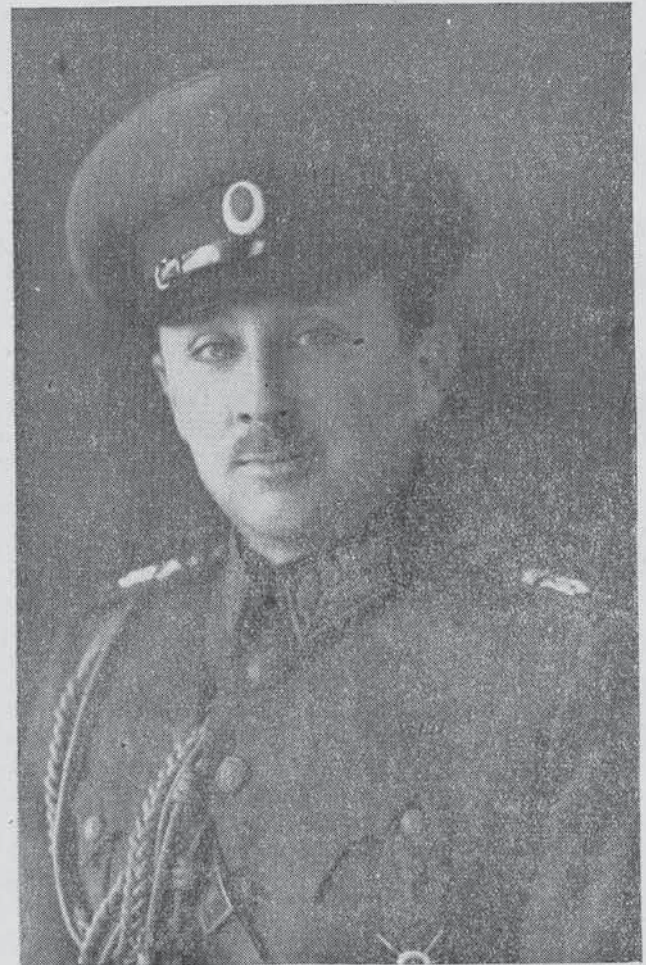
Н. Ц. Височество Князь Кирилъ Преславски

М-ръ Предс. Д-ръ Б. Филовъ — Тукъ Покрусени отъ неочакваната кончина на любимия ни царь Борисъ обединителъ на българския народъ, Илинденци се прекланятъ предъ свѣтлия му ликъ и великитѣ му дѣла и даватъ най-искрени увѣрения че ще пазятъ и изпълняватъ неговитѣ завети въ вѣрна служба на хубава и Обединена България. Вѣчна паметъ на Царя обединителъ.