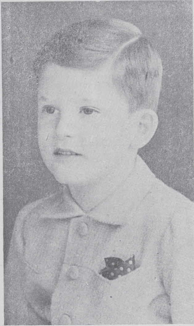
Н. В. Симеонъ II, Царь на българитѣ

До Нейно Величество Царицата—Двореца Тукъ