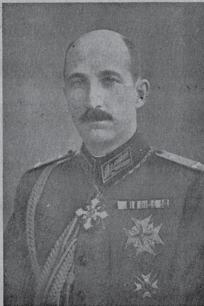
О'ВОЗЕ ПОЧИНАЛИЯТЪ ЦАРЬ-ОБЕДИНИТЕЛЬ БОРИСЪ III.