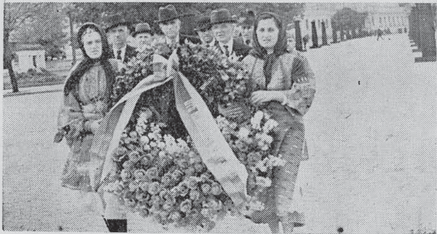
Вѣнецътъ, който Ржководното тѣло на Илинд. организа- ция поднесе предъ тленнитѣ останки на О'Бозе починалия Царь Борисъ III