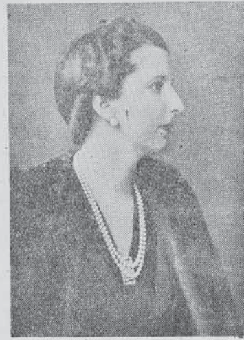
Н. В. Царица Иоанна