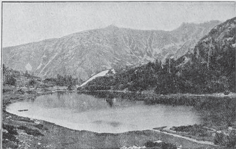
Очарователни изгледи изъ Пиринъ планина.