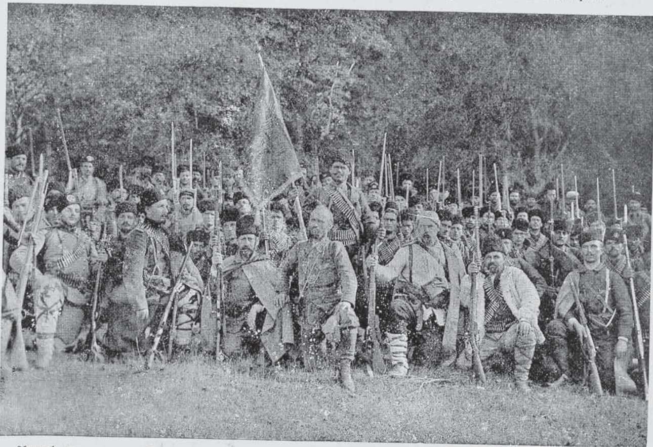
Сборнитѣ чети на генералъ Иванъ Цончевъ съ чуждестранни кореспонденти въ Пирина даватъ клетва при знамето на революцията.

Четитѣ трѣбваше да придружатъ бежанцитѣ, понеже войска имаше по постовѣтѣ. Води се ожесточенъ бой на 18 и 19 септемврий между четитѣ и войската при Семково. Четитѣ разбиха поста и отвориха пѣтъ на бежанцитѣ за България.