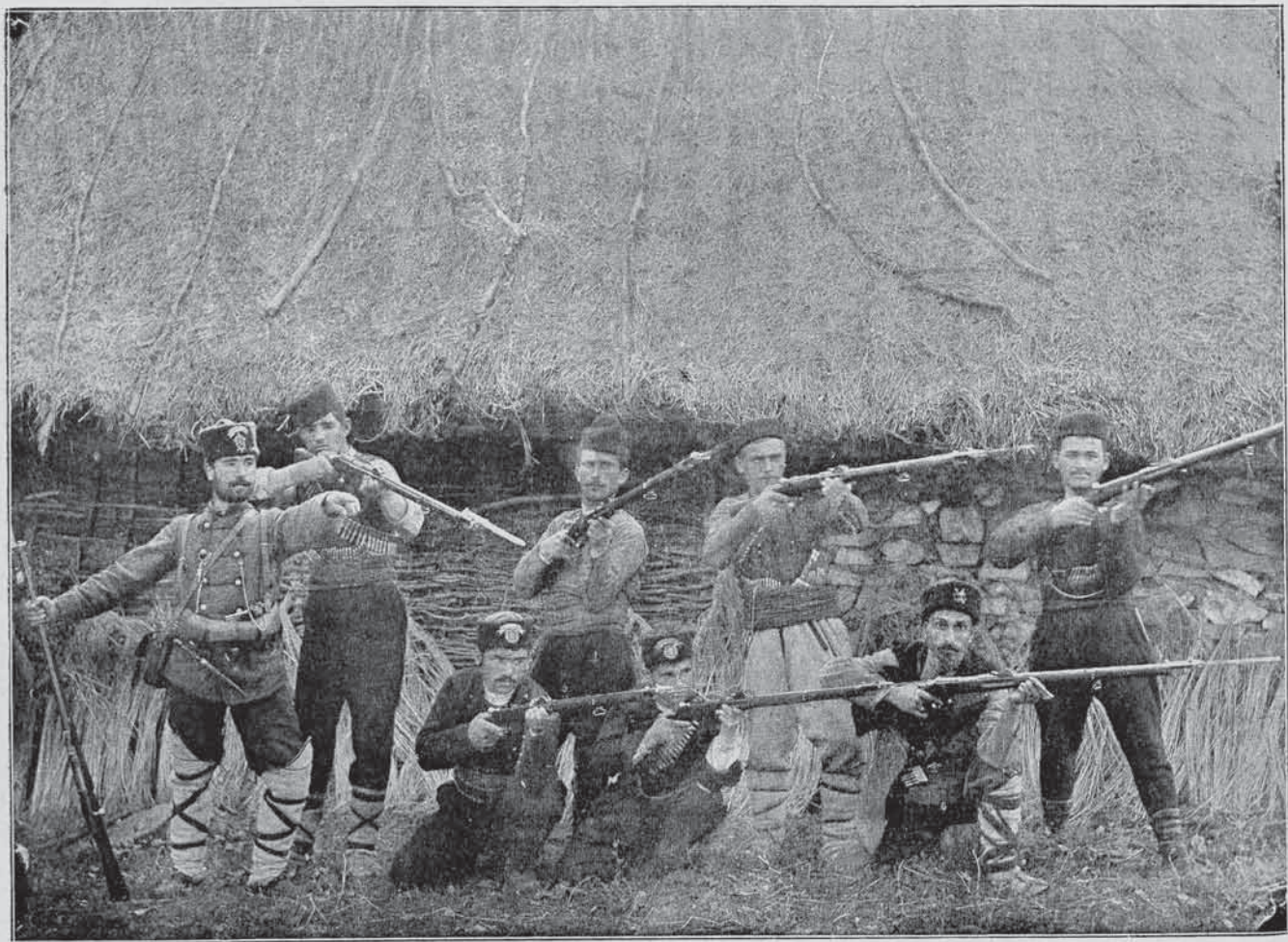
Четнишки упражнения въ стрелба.

Младо и старо, мъже и жени, учени и прости — всичко вложи силитѣ си въ помощъ на подетата