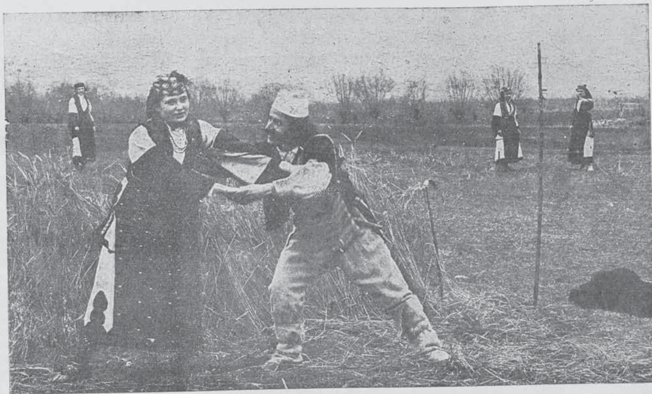
Сцена изъ драмата „Македонска кървава сватба“ — Заграбването на Цвѣта

Отъ далнинитѣ сини те гледа тжно Шаръ, Надежда той ти праща като на скжпъ другаръ, А Стогово съ горчиви налѣни е очи, Вищарица чело си навжсила, мълчи!