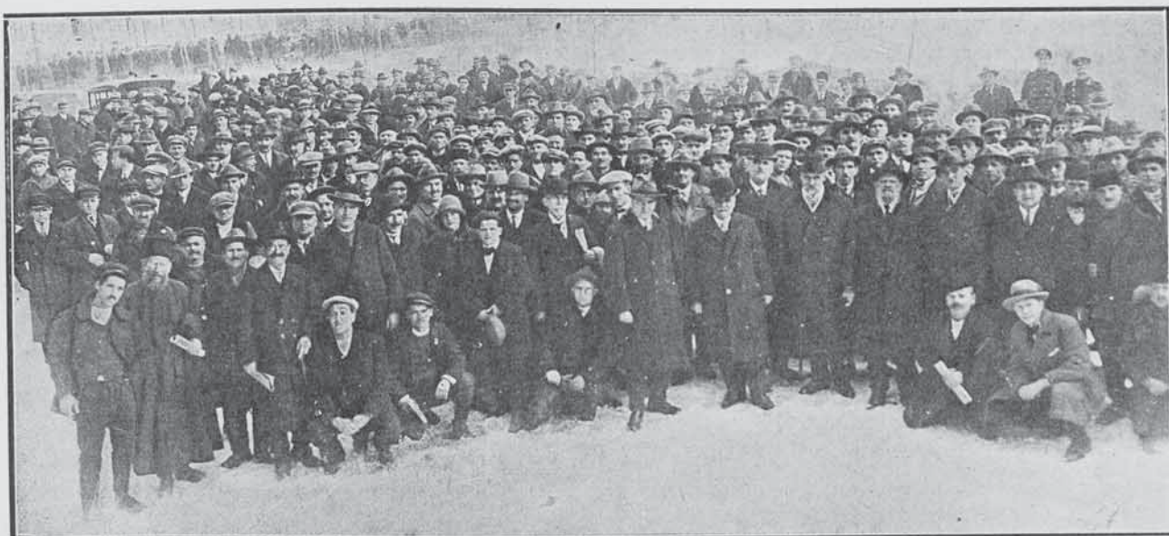
Делегатитѣ на конгреса.