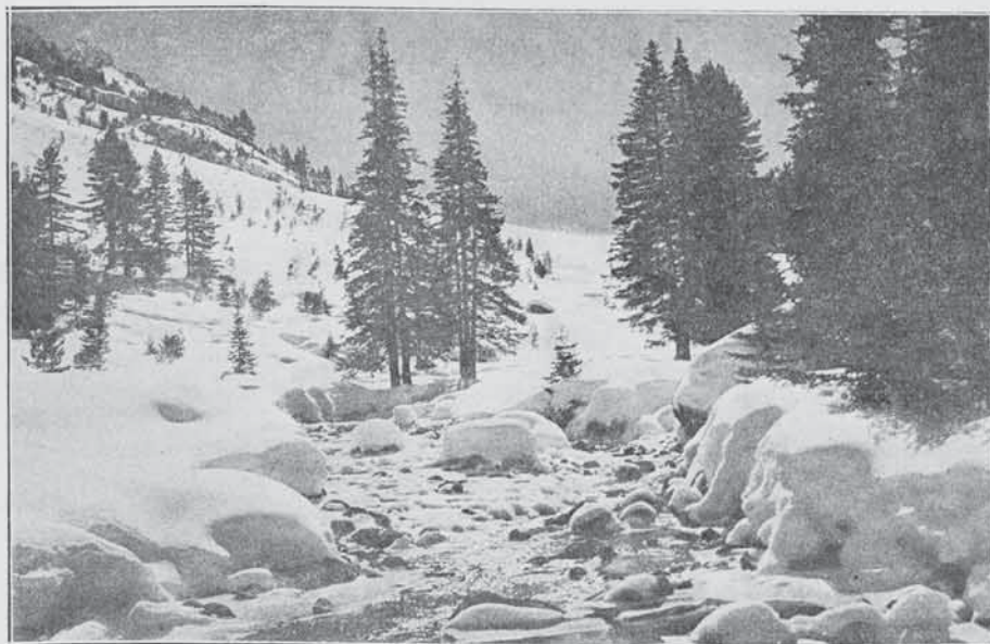
Кътъ отъ Пиринъ планина презъ зимния сезонъ

Следъ опразването на първата позиция, турцитѣ, окуражени, бѣсно налитатъ на насъ. Нашата позиция сега бѣ най-застрешена, най-силно атакувана. Борисъ Стрезовъ тича отъ юнакъ на юнакъ, дава нареждания, окуражава, подбира