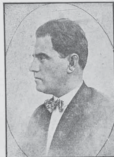
Панчо Тошевъ подпредседателъ